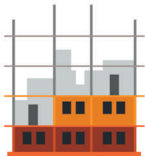
ОБЪЕКТ НЕЗАВЕРШЕННОГО СТРОИТЕЛЬСТВА