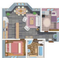
КВАРТИРА (ЧАСТЬ КВАРТИРЫ, КОМНАТА)