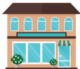
ИНЫЕ ЗДАНИЕ, СТРОЕНИЕ, СООРУЖЕНИЕ