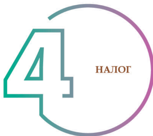
ШАГ 4. РАСЧЕТ НАЛОГА