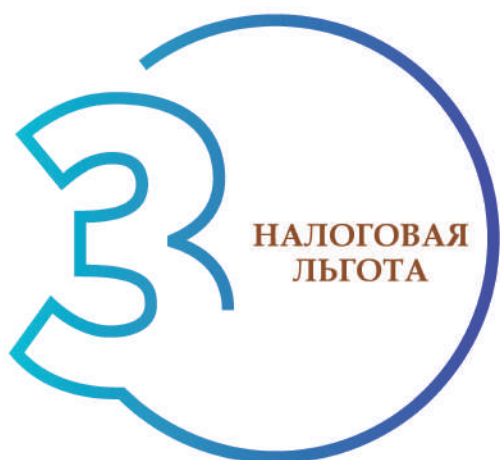
ШАГ 3. ОПРЕДЕЛЕНИЕ НАЛОГОВОЙ ЛЬГОТЫ