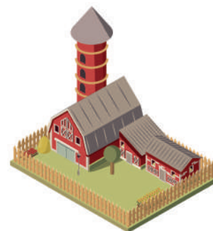
ЕДИНЫЙ НЕДВИЖИМЫЙ КОМПЛЕКС